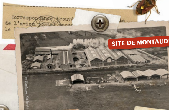
SITE DE MONTAUDRAN