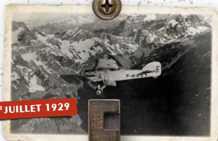
1 ER JUILLET 1929