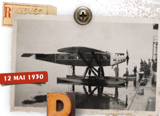
12 MAI 1930