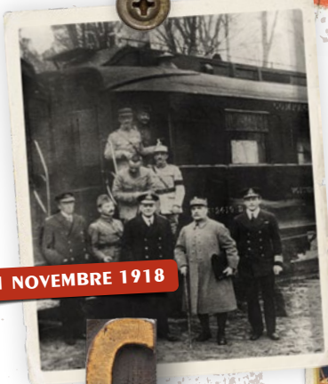
11 NOVEMBRE 1918