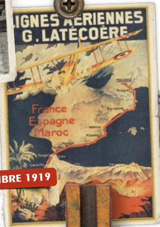
1 ER SEPTEMBRE 1919