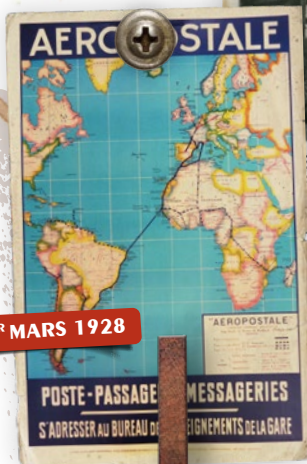
1 ER MARS 1928

SYLÉBRIX, 12400 KILOMETRES AS, RAID AEREC BUENOS AIRES.