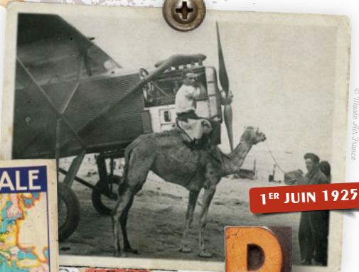
1 ER JUIN 1925