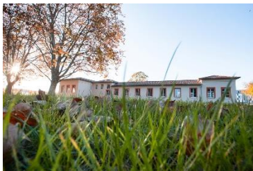
Vues du champ d'aviation