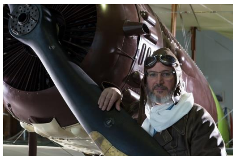
Animation incarnée : un pilote raconte les anecdotes de l'aéropostale devant l'avion Salmson 2A2

Des médiateurs en tenue d'époque pour plonger les visiteurs dans le quotidien d'Antoine de Saint Exupéry