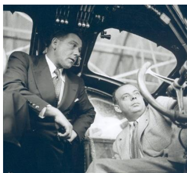
Henry Guillaumet et Antoine de Saint-Exupéry.