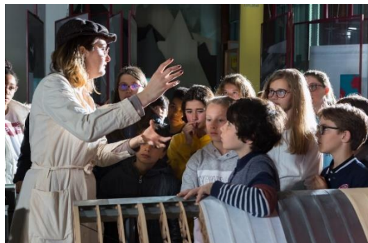
Atelier éducatif ©L'Envol des Pionniers-Auteur Manuel Huynh

Les visiteurs vont découvrir comment l'aviateur Antoine de Saint Exupéry est devenu l'écrivain du Petit Prince à travers des activités pratiques et sensorielles à partager en famille.