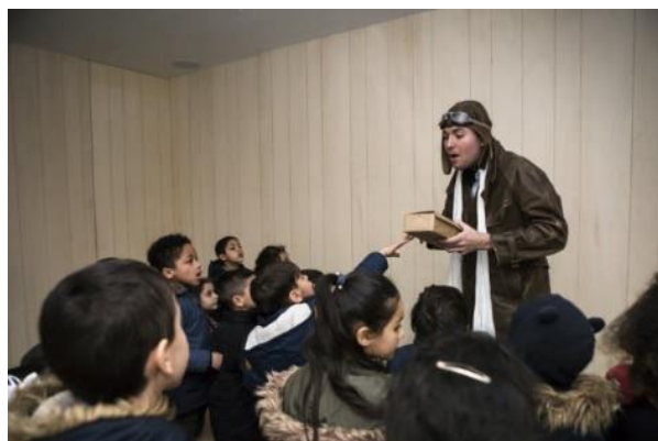
Atelier « histoires de Pilotes »

Conventionné par l'Éducation Nationale, L'ENVOL DES PIONNIERS propose une offre entièrement conçue pour les publics scolaires. Son équipe éducative innove en permanence pour proposer de nouveaux produits adaptés à chaque âge. Les ateliers s'inscrivent en complémentarité des connaissances acquises en classe dans différentes matières scolaires.