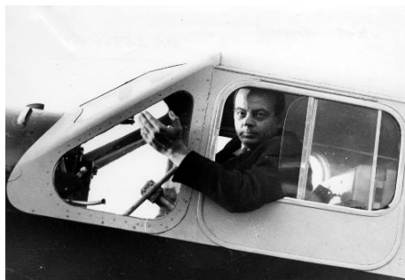
Antoine de Saint Exupéry dans le Caudron Simoun en 1935

Le parcours se poursuit par l'exposition temporaire au cœur du hangar à avions de 400m 2 de L'ENVOL DES PIONNIERS. Les visiteurs partent alors à la rencontre d'Antoine de Saint Exupéry « l'aviateur ». Chaque étape de l'exposition présente un moment clé de son riche parcours de vie et l'avion de légende associé à cette période. Le visiteur pourra ainsi découvrir une réplique taille réelle du premier avion de La Ligne , le SALMSON 2A2 sur lequel Antoine de Saint Exupéry a volé pendant son service militaire.