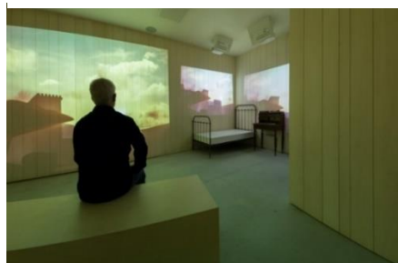
Reconstitution du baraquement de Cap Juby à ©L'Envol des Pionniers-Auteur Manuel Huynh

Dans la première partie du parcours, les visiteurs découvrent l'histoire de l'aéropostale, du site de Toulouse Montaudran, de ses Hommes et de ses légendes par le biais de l'exposition permanente de L'ENVOL DES PIONNIERS. Car c'est sur ce site, à l'endroit même où petits et grands déambulent, que le célèbre Antoine de Saint Exupéry devient pilote des Lignes Aériennes Latécoère le 14 octobre 1926. À travers une médiation incarnée , des interventions jouées par des personnages en tenues d'époque (pilotes, mécaniciens, ouvrières entoileuses) et des dispositifs muséographiques originaux , le visiteur comprend les prouesses techniques et surtout humaines des débuts du transport du courrier, par-delà les déserts, océans et montagnes. L'ENVOL DES PIONNIERS propose aux visiteurs une exploration inédite de l'histoire mouvementée l'aéropostale.