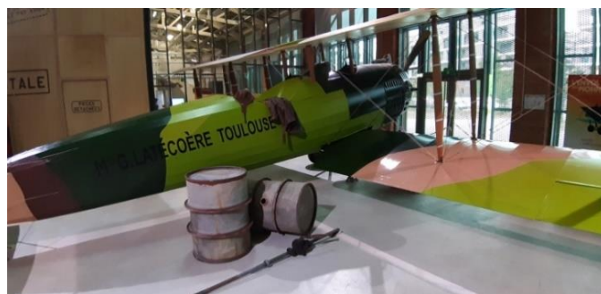
Avion Salmson 2A2 taille réelle.

Si les romans d'Antoine de Saint Exupéry regorgent d'épopées aériennes, c'est parce que le romancier nourrissait une grande passion pour les avions. Sa carrière de pilote et son parcours d'écrivain sont intimement liés, l'un inspirait l'autre. L'exposition retrace la vie du légendaire pilote depuis son baptême de l'air à l'âge de 12 ans, jusqu'à sa mort tragique au-dessus de la méditerranée. Autour d'une scénographie inédite alliant objets personnels, ambiances sonores, récits et avions de légende, l'exposition invite le public à découvrir le parcours de cet homme courageux et profondément humaniste. La plupart des avions qu'il a pilotés jalonnent, par de grands visuels, le parcours de l'exposition et racontent de manière chronologique les petits et grands moments de vie d'Antoine de Saint Exupéry. Parmi les objets exposés, le public pourra notamment admirer des morceaux de l'avion légendaire Lockheed F-5 Lightning – à bord duquel Antoine de Saint Exupéry disparut le 31 juillet 1944 en Méditerranée – restaurées par les équipes du Musée de l'Air et de l'Espace.