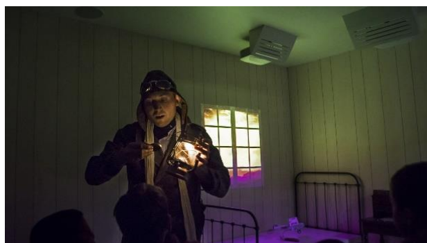
Atelier « histoires de Pilotes »

Un apprenti pilote s'apprête à vivre son tout premier vol. Les élèves aident le jeune aviateur à retrouver son courrier au wagon postal et à s'équiper pour cette nouvelle aventure. Au fil des lettres, ils découvrent ensemble les incroyables récits d'Antoine de Saint Exupéry et de ses camarades, pilotes de l'Aéropostale.