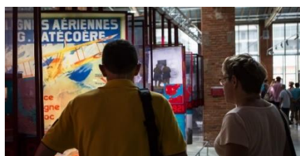
Evocation des Lignes Aériennes Latécoère nées à Toulouse-Montaudran. Photo © L'Envol des Pionniers Auteur Manuel-Huynh