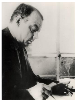
2 photos : haut et bas : Antoine de de Saint-Exupéry.

Amoureux, Saint-Exupéry l'était aussi de la littérature et du cinéma. L'exposition revient sur les films qui ont forgé sa notoriété outre-Atlantique. Ainsi, dans le « coin ciné », les visiteurs visionnent de courts extraits directement inspirés de l'œuvre d'Antoine de Saint-Exupéry ; soit pour le cinéma avec Anne-Marie dont il a écrit le scénario en 1935 (réalisé par Raymond Bernard et sorti en 1936) ou l'adaptation de son premier livre Courrier Sud (réalisé par Pierre Billon et sorti en 1937), mais aussi par des documentaires pour Air France tels que Week-end à Alger et Atlantique Sud (réalisé par Félix Forestier en 1936 à l'occasion de la centième traversée de l'Atlantique Sud).