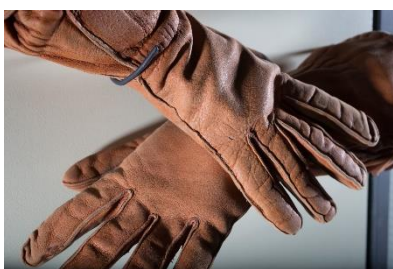
Les véritables gants de pilote d'Antoine de Saint Exupéry exposés à L'Envol des Pionniers. Succession Antoine de Saint Exupéry-d'Agay- Auteur © Manuel.Huynh.

L'ENVOL DES PIONNIERS propose au public une exposition inédite sur cet homme de légende. Autour d'installations sonores et visuelles, de documents inédits (lettres, journaux, livres, documents ...) et d'évocations d'avions légendaires, le visiteur découvre une autre facette du créateur du Petit Prince : celle de l'audacieux aviateur. L'exposition retrace la vie de ce pionnier volant depuis son vélo ailé de petit garçon jusqu'à sa mort tragique au-dessus de la Méditerranée à bord de son avion de reconnaissance, le légendaire Lockheed F-5 Lightning.